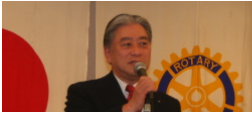
開会挨拶 南條副会長(陵北)