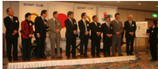
広島安佐RC 次年度理事役員