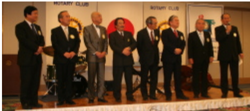
広島陵北RC 次年度理事役員